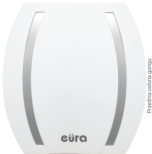
Przednia osłona gongu